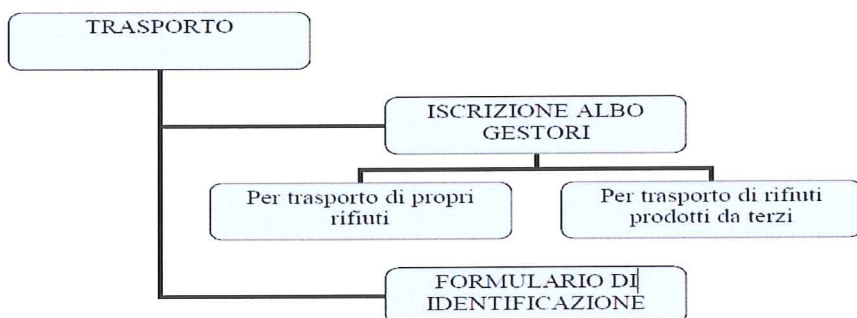
Figura 3 – Gestione delle attività di trasporto dei rifiuti di cantiere

Per trasporto si intende la movimentazione dei rifiuti dal luogo di deposito – che è presso il luogo di produzione – all'impianto di smaltimento.